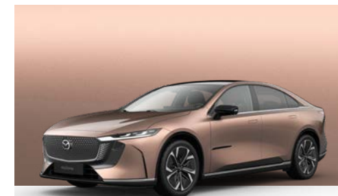
MELTING COPPER | € 1.050