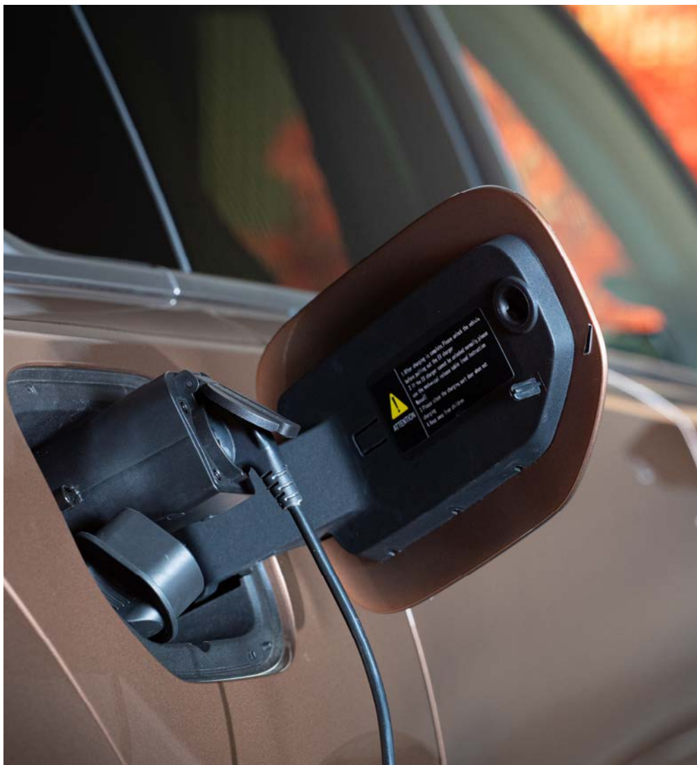
VEHICLE-TO-LOAD (V2L) ADAPTER