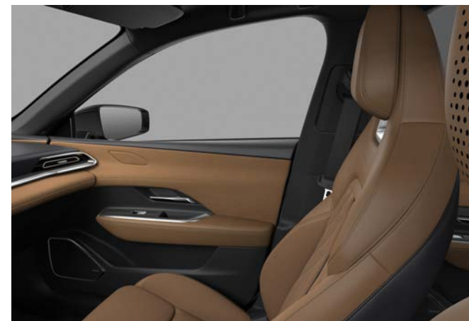
Nappa leder & suède stof - Tan (zwarte hemelbekleding)