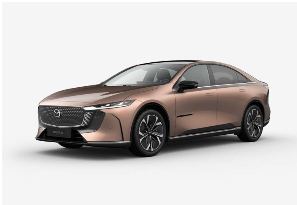
Foto: Mazda6e in Melting Copper