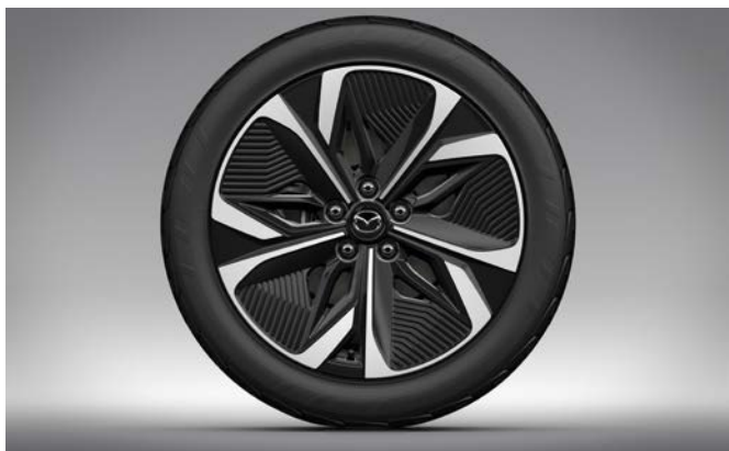
19-inch lichtmetalen velgen (245/45R19 Michelin)