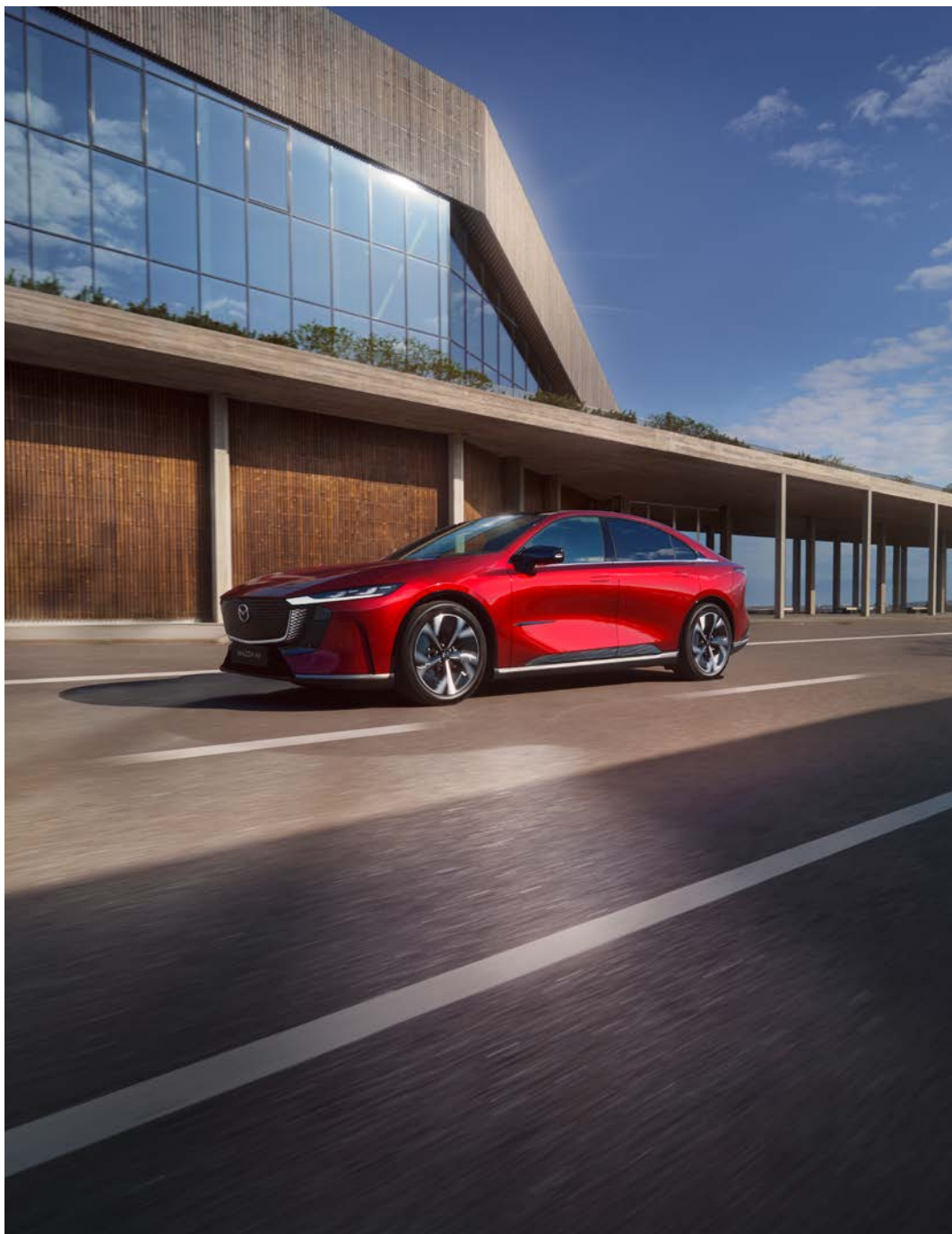
Foto: Mazda6e in Soul Red Crystal