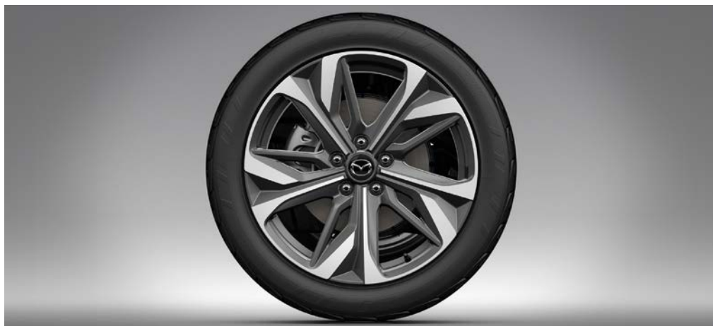
19-INCH LICHTMETALEN VELGEN, DESIGN 180