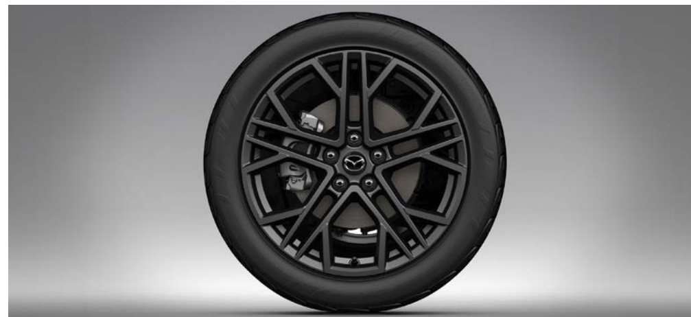
19-INCH LICHTMETALEN VELGEN, DESIGN 77, ANTHRACITE GLOSSY