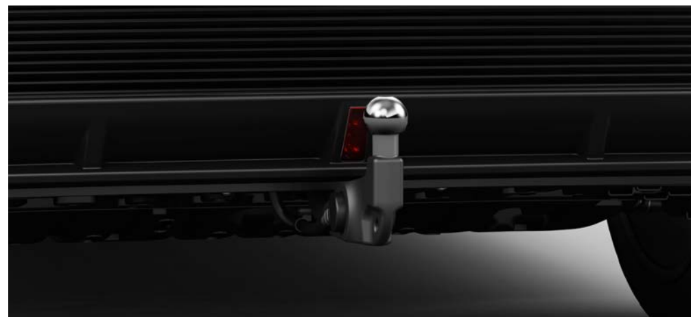
ELEKTRISCH WEGKLAPBARE TREKHAAK