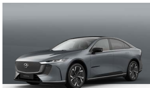
POLYMETAL GREY | € 1.050