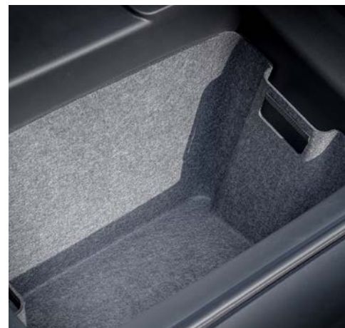
FRUNK-BESCHERMER & BAGAGEBOX