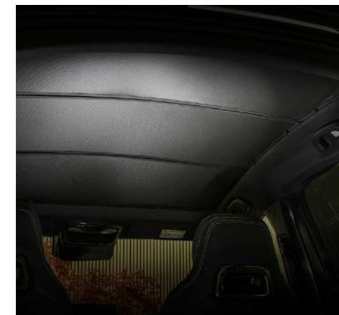
ZONNESCHERM (ENKEL VOOR TAKUMI)