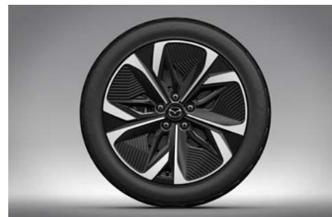
19-inch lichtmetalen velgen (245/45R19 Michelin)