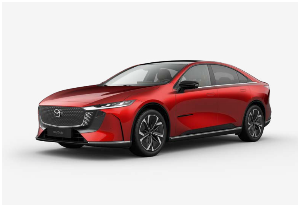
Foto: Mazda6e in Soul Red Crystal