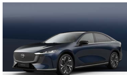
DEEP CRYSTAL BLUE | € 1.050