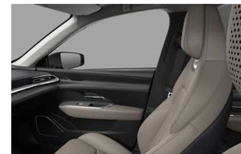
Kunstleder - Warm Beige (lichtgrijze hemelbekleding)