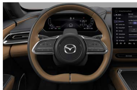
Lederen stuurwiel, in two-tone (Zwart - Tan)