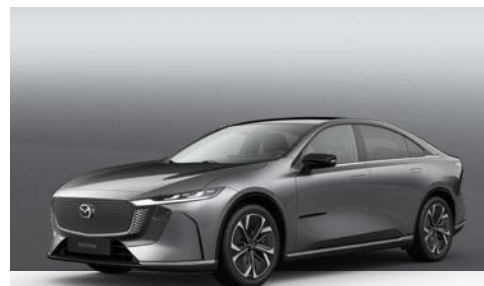
MACHINE GREY | € 1.250