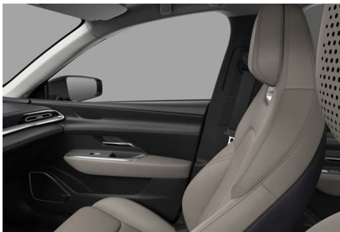
Kunstleder - Warm Beige (lichtgrijze hemelbekleding)