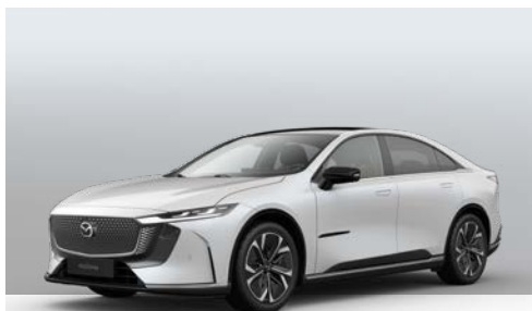
CRYSTAL WHITE PEARL | € 0