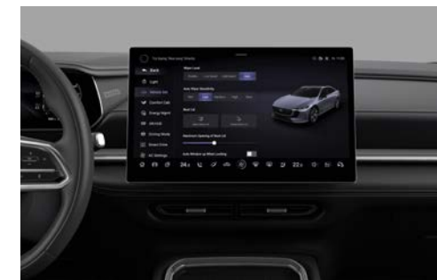
14,6-inch centrale display