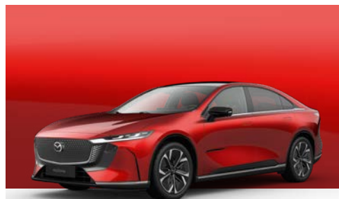
SOUL RED CRYSTAL | € 1.400