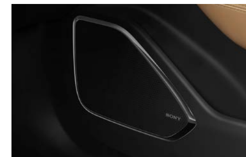
Sony-audiosysteem met 14 speakers