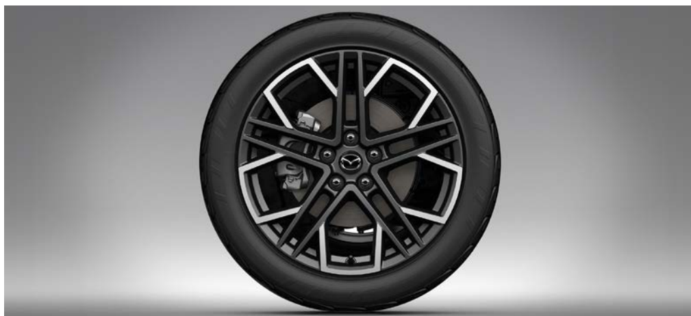
19-INCH LICHTMETALEN VELGEN, DESIGN 77A, ANTHRACITE GLOSSY, DIAMOND CUT