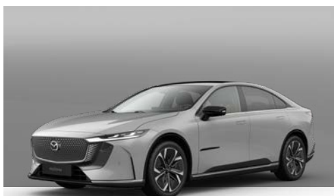
AERO GREY | € 1.050