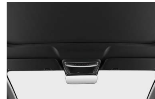
Elektrisch bedienbaar zonnescherm voor panoramadak