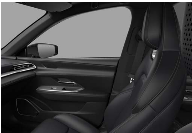
Kunstleder - Black (zwarte hemelbekleding)