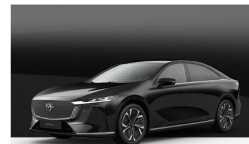
JET BLACK | € 1.050

Ontdek alle kleuren en stel jouw Mazda6e samen: