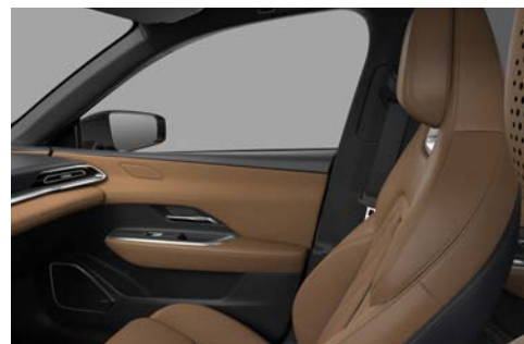
Stoelbekleding Tan Nappa-leder met suède stoffen zitting